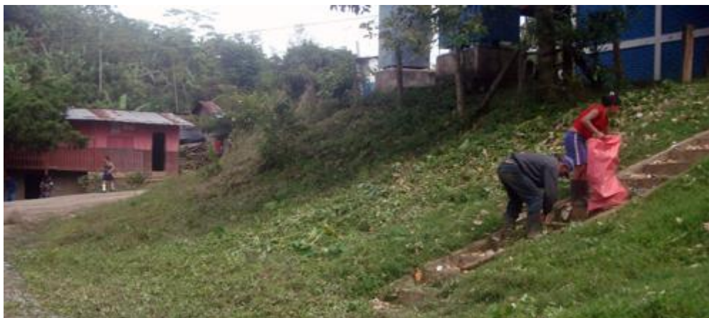
Jornada de limpieza en la comunidad

Para el fortalecimiento de los CAPS se utilizó una metodología para analizar en conjunto la problemática de agua y saneamiento en su comunidad y plantear acciones concretas para realizar mejoras. 36 CAPS han elaborado un Plan de Higiene y Saneamiento en las comunidades y estaban en el proceso de implementación de las acciones identificadas. 21 comunidades han realizado una campaña de limpieza de su propia comunidad.