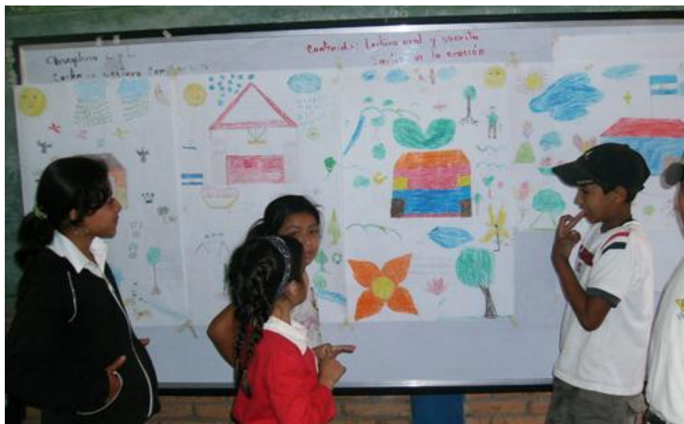
Sesión con Niños y niñas de Jiguina

Se espera que la temática de agua y prácticas de higiene sea integrada en la vida cotidiana de la población de las comunidades, que los pobladores asimilen mejoras en sus conductas de higiene y sigan implementando acciones concretas para proteger sus recursos de agua y el ambiente en sus comunidades.