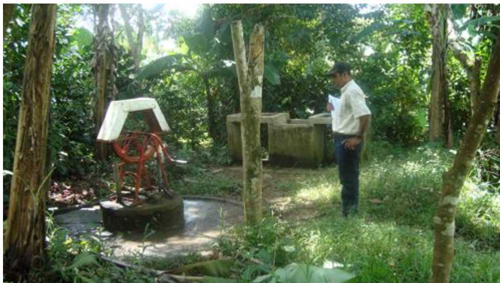
Sistema de agua potable comunitario

administrativo/financiero de los sistemas de agua. También las capacidades técnicas de los CAPS requieren ser reforzadas para poder administrar, operar y mantener sus sistemas de agua con un buen nivel de servicio.