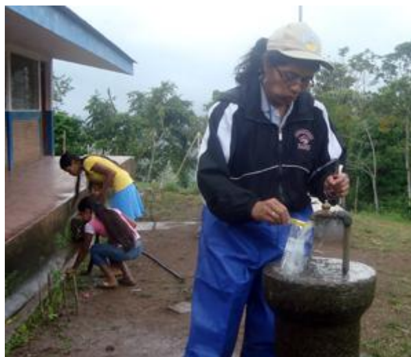
Muestreo de la calidad de agua

En el marco de contar con mayor información sobre la contaminación de agua con coliformes fecales se realizó en coordinación con el Ministerio de Salud muestreos de calidad de agua en 35 comunidades. De las 91 muestras, 85 resultaron con una contaminación de coliformes fecales, dejando el agua como no apta para consumo humano.