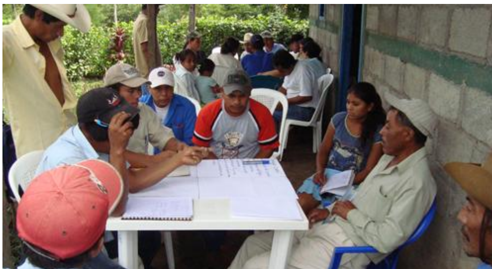
Capacitación a los CAPS

Resultado 3: Principales actores locales cuentan con más capacidad para asumir sus competencias, establecer coordinaciones interinstitucionales e incidir en la gestión pública de los servicios de agua potable y saneamiento, así como en el manejo sostenible de las fuentes de agua.