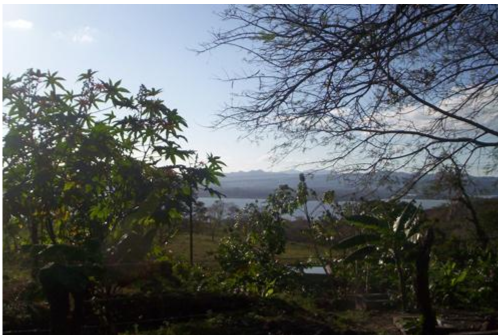
Paisaje del municipio de Jinotega

Nicaragua es uno de los países con mayores recursos hídricos en el mundo. Inmensos lagos y ríos cruzan su territorio. A pesar de ello, no todas las personas tienen acceso al agua: para muchas comunidades rurales se ha convertido en un problema la deforestación, contaminación, dificultades de acceso e intentos de privatización.